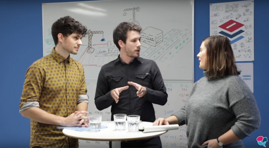
1. Diskussionen schauen